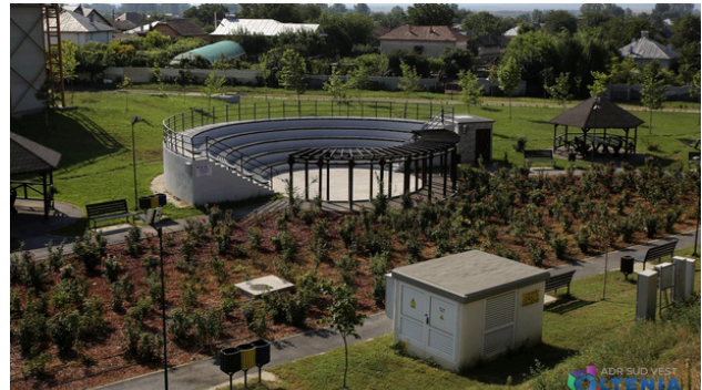
Spații verzi în Dăbuleni, cu finanțare europeană

Obiectivele și direcțiile de acțiune ale Politicii Urbane a României au fost stabilite pe termen mediu și lung pentru a acoperi două perioade de programare financiară ale UE, iar Planul de acțiune 2022-2030 propus conține măsuri pe termen scurt și mediu, urmând ca după o evaluare intermediară, acest document să fie revizuit și extins astfel încât să fie acoperită întreaga orizont de timp al Politicii Urbane.