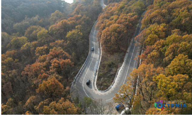
Modernizarea cu fonduri europene a celui mai lung drum din județul Olt, drumul 546 Dăneasa-Slatina-Verguleasa

Aceste programe reflectă angajamentul UE de a sprijini orașele în a deveni mai sustenabile, mai eficiente din punct de vedere al resurselor și mai incluzive.