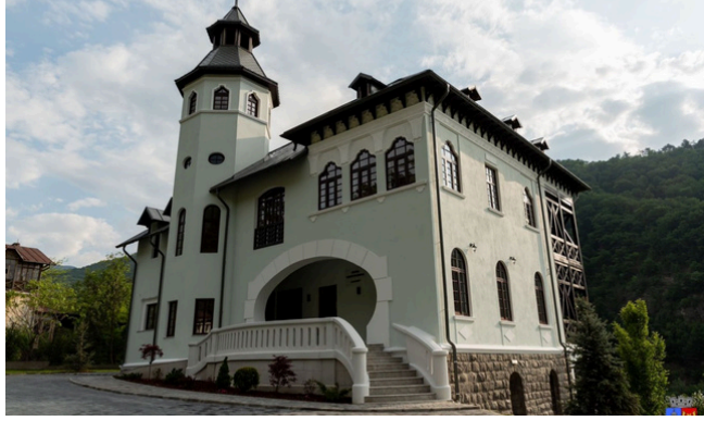
Reabilitarea, modernizarea și extinderea Centrului Multifuncțional din Călimănești, cu fonduri europene

Aceste programe reflectă angajamentul UE de a sprijini orașele în a deveni mai sustenabile, mai eficiente din punct de vedere al resurselor și mai incluzive.